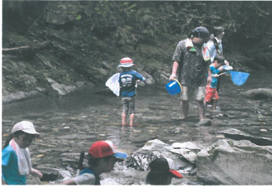
川の生物と遊ぼう