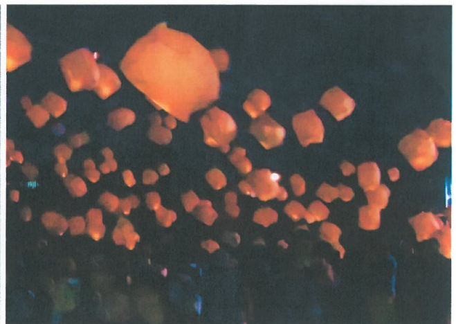
パルーンランタン