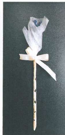
ラベンダーのつぼみ